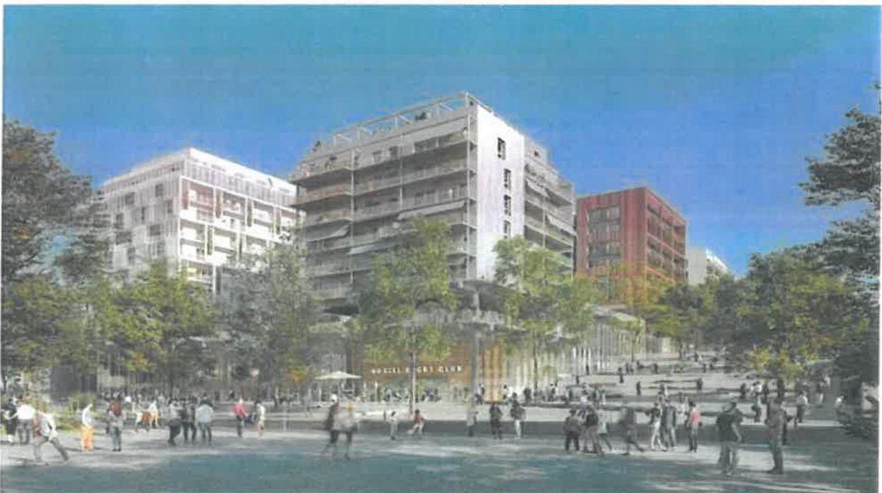
Icade Promotion construira une partie du Village olympique de Paris 2024

Icade, l'un des trois premiers maîtres d'ouvrage immobilier du palmarès BBKA 2020, démontre son fort engagement en matière de bas carbone depuis déjà plusieurs années. Et la filiale de la Caisse des dépôts compte aller encore plus loin. Explications.