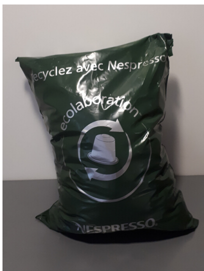
Sac de dosettes usagées, lui-même valorisé en énergie

Pour information, en 2019, nos émissions de CO 2 (trajets professionnels et bureaux) ont représenté 540 tonnes de CO 2 .